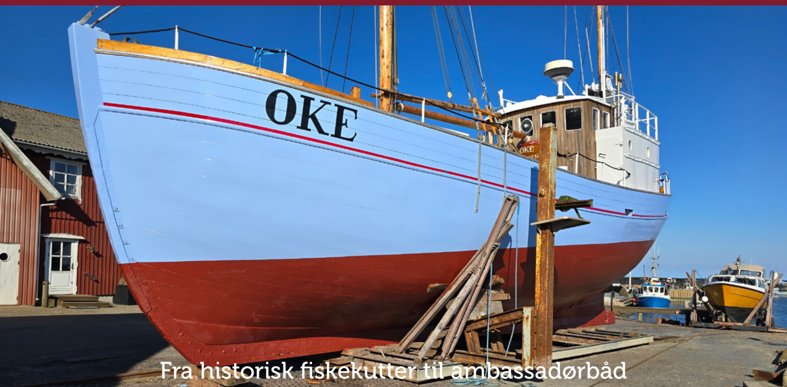
Fra historisk fiskekutter til ambassadørbåd